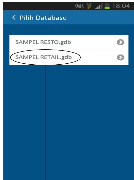
Tampilan gambar pada Tablet

Pilih salah satu database untuk Membuka data transaksi