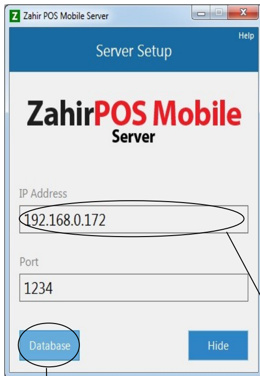
Tampilan gambar pada ZahirPOS Mobile Server

Untuk menambah database klik Tombol "Database"